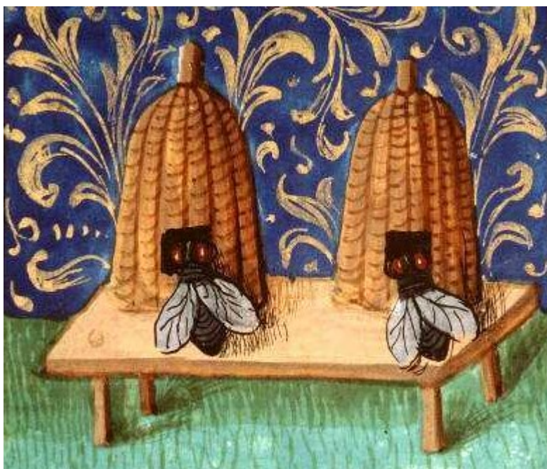
De Proprietatibus rerum, Amiens, BM, ms. 399, f. 140v

2 e et 4 e jeudis du mois de 17 h à 19 h, du 27 novembre 2014 au 28 mai 2015 EHES, salle 9, 105 bd Raspail 75006 Paris