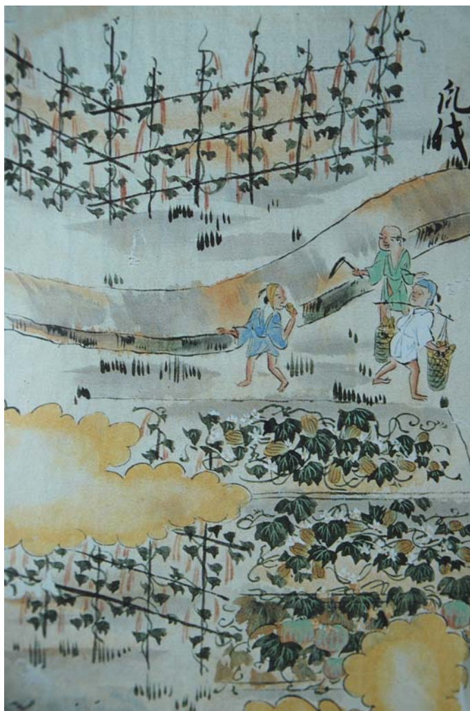
Récolte du melon, 6 e lune.