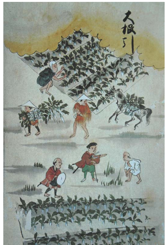
Récolte du gros radis, 10 e lune.